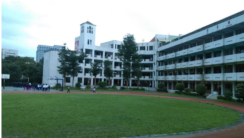
圖(一)飛行競賽場地